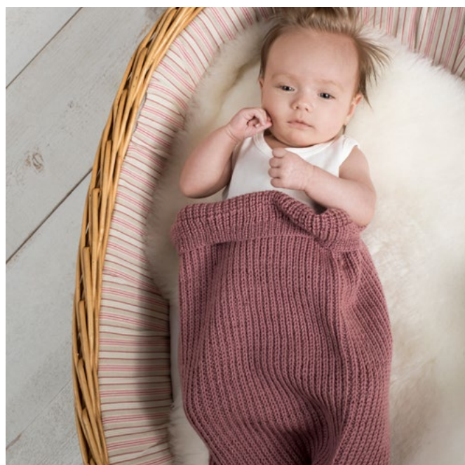
Prøv den i rus rose | DG422-06