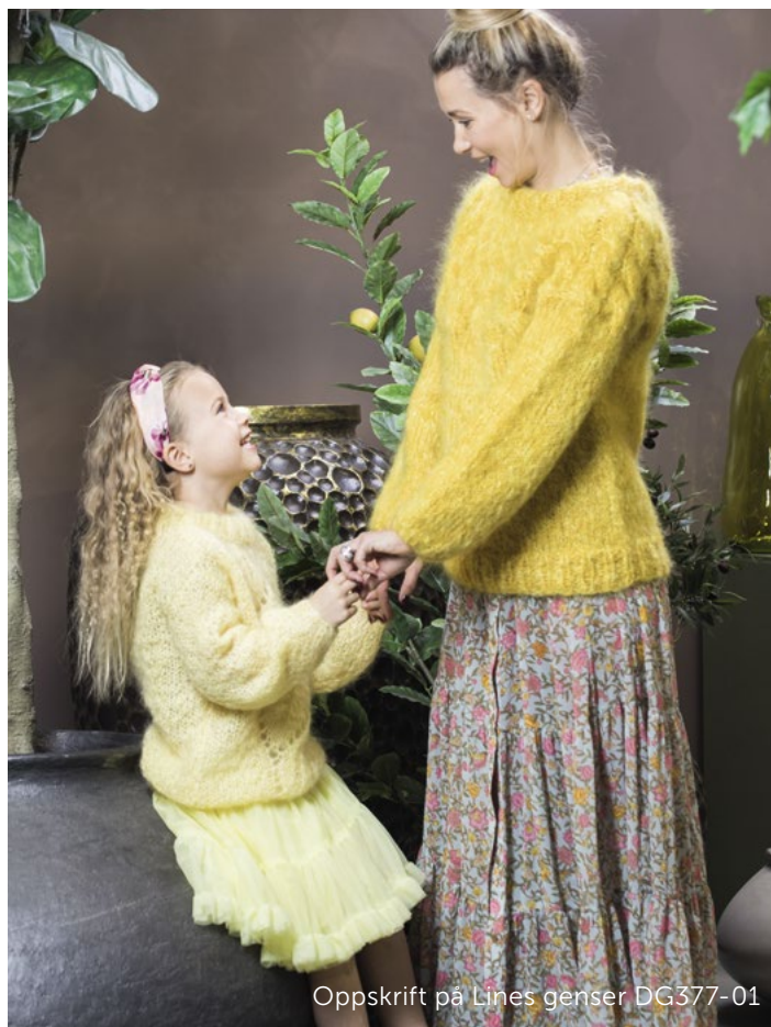
Oppskrift på Lines genser DG377-01

Brett halskanten dobbel mot vrangen og sy til med løse sting.