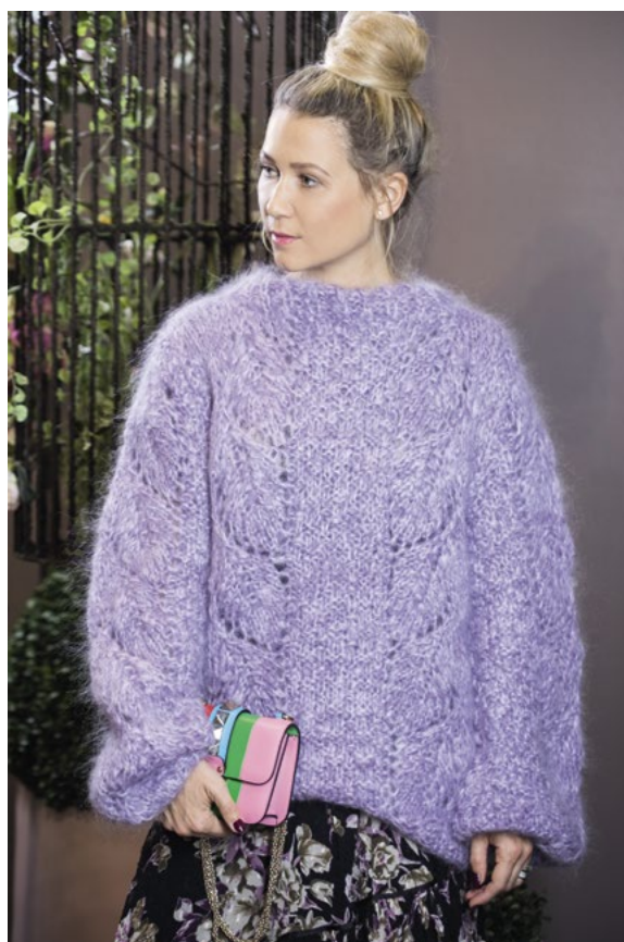
Finnes også til voksen | DG 377-08