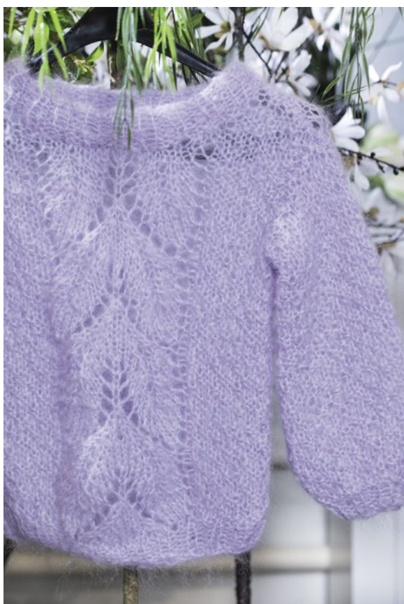
Prøv genseren i lavendel | DG 377-15